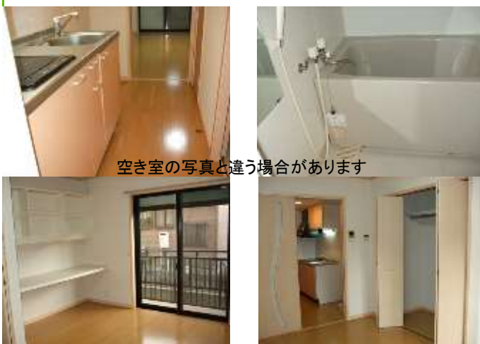
空き室の写真と違う場合があります