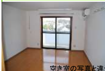
空き室の写真と違う場合があります