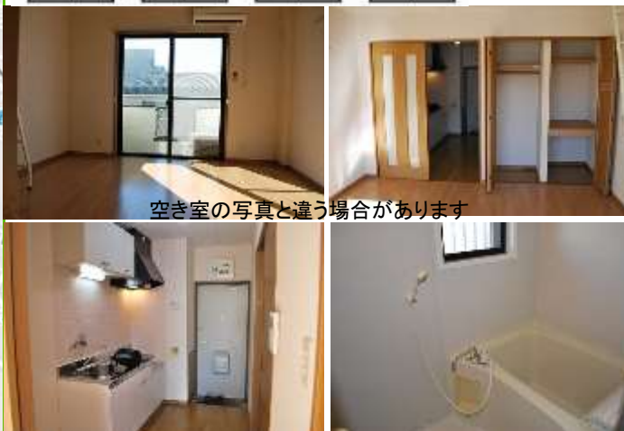
空き室の写真と違う場合があります