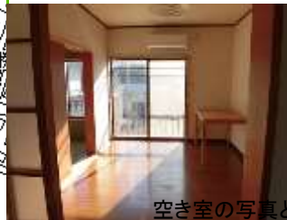
空き室の写真と違う場合があります