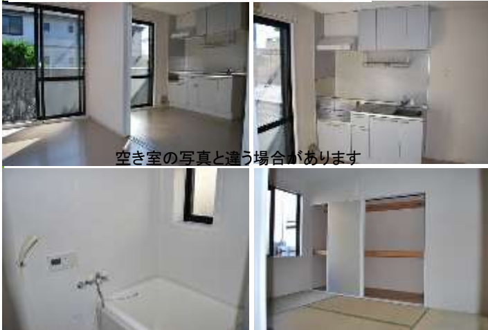
空き室の写真と違う場合があります