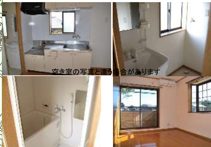
空き室の写真と違う場合があります