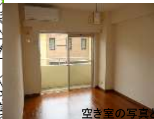
空き室の写真と違う場合があります