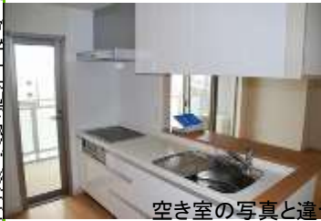
空き室の写真と違う場合があります