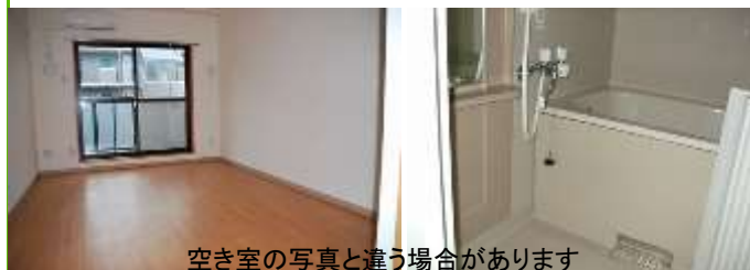
空き室の写真と違う場合があります