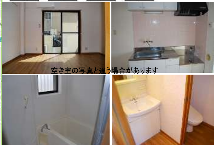
空き室の写真と違う場合があります