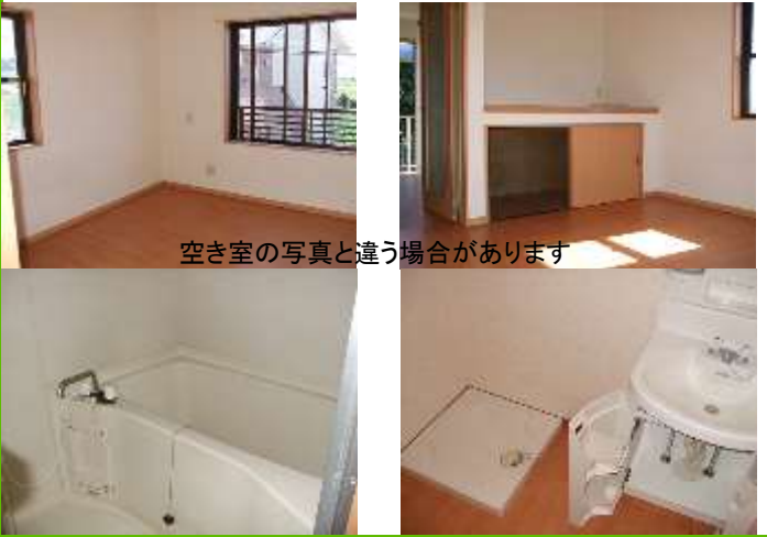
空き室の写真と違う場合があります