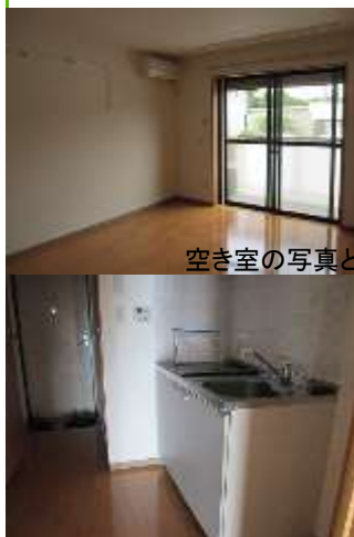
空き室の写真と違う場合があります