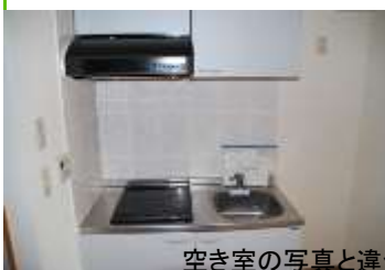
空き室の写真と違う場合があります