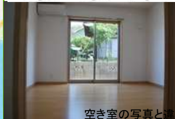
空き室の写真と違う場合があります