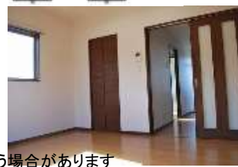
空き室の写真と違う場合があります