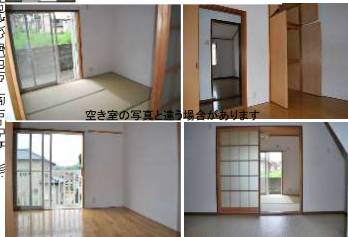
空き室の写真と違う場合があります