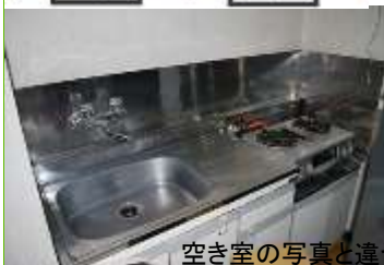
空き室の写真と違う場合があります